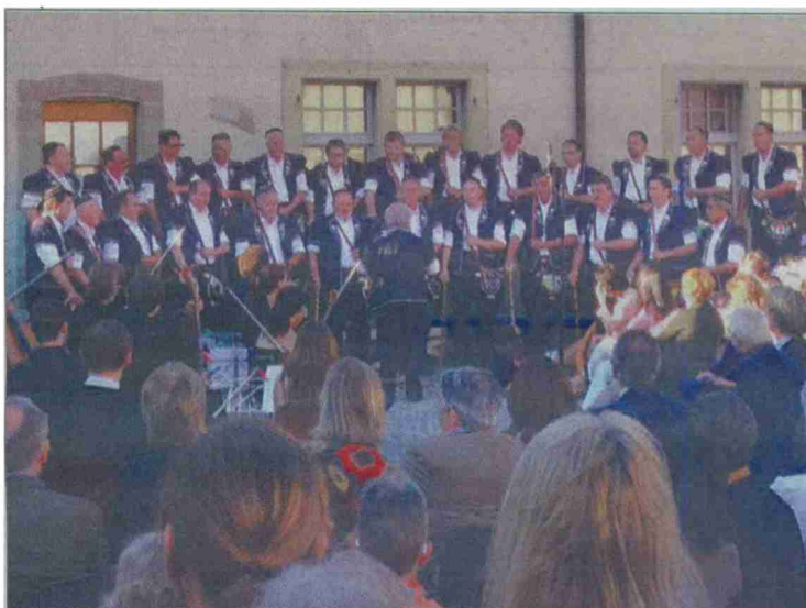
Le Chœur des Armaillis de la Gruyère.